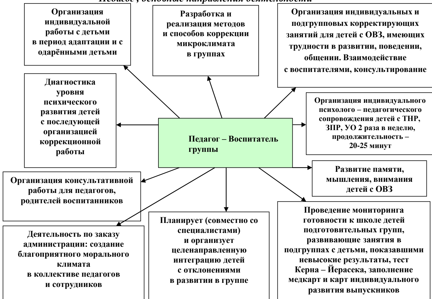
Рис. 2 «Педагог - воспитатель, основные направления деятельности»