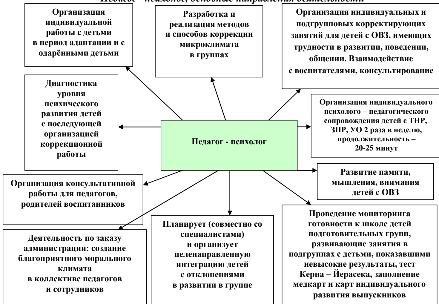
Рис. 2 «Педагог - психолог, основные направления деятельности»